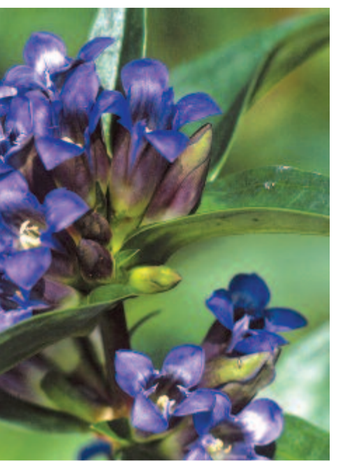
Szent László füve

kastélyparkot építő imádságod. Bejártam én a Toldalagi kertet Koronka fölött. Lombjaid feleltek kérdésemre. Talán itt voltál boldog (...)