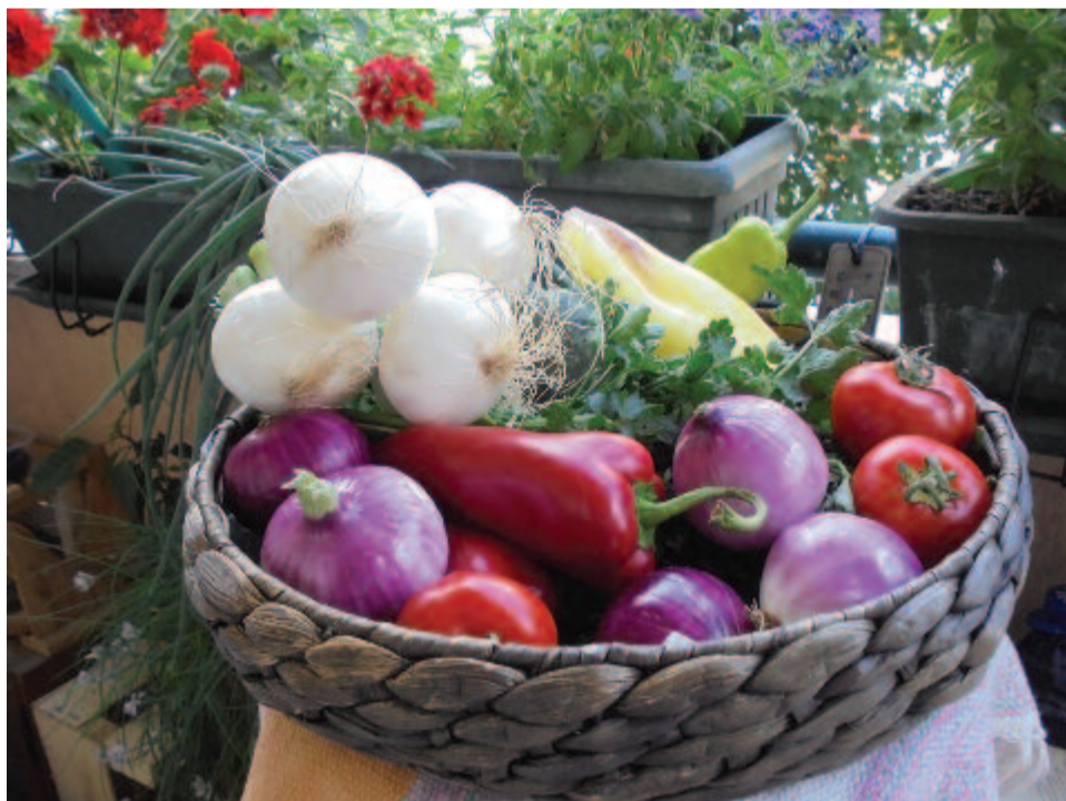
A vasfű lángzó virágai előtt kosárrnyi nyár ajándék

Emberi lélek: Olyan vagy, mint a víz, Emberi sors: Olyan vagy, mint a szél.